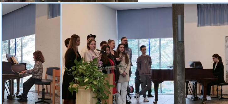
Vielerlei musikalische Beiträge bereichern den festlichen Gottesdienst.