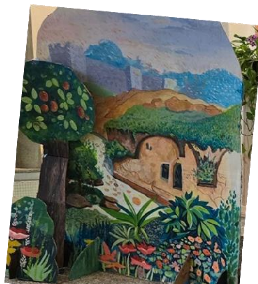
Kulisse, gemalt von Oksana Semeniuk