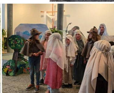
Zwei Detektive versuchen herauszufinden, was an Ostern wirklich passiert ist.